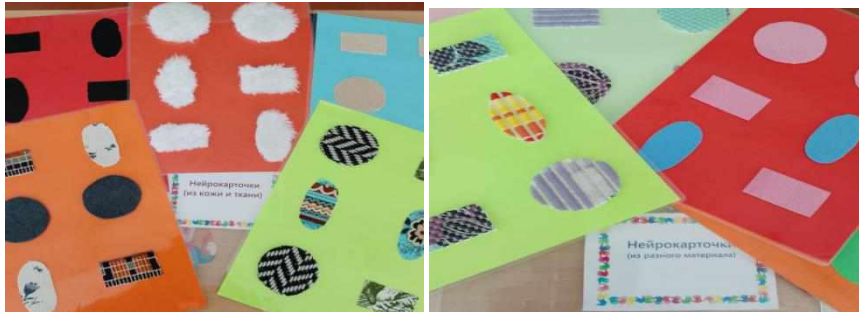
Карточки из разного материала

Методические рекомендации по использованию пособия: при использовании нейрокарточек упражнения выполняются одновременно обеими руками, каждая геометрическая фигура имеет определённые движения рук. (смотреть правила работы с нейрокарточками).