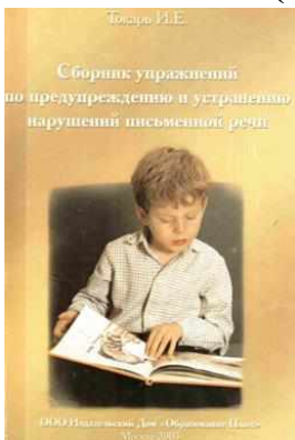
Фото пособия (не более 3 шт).

Введение Современные требования к качеству подготовки учащихся требуют от учителя соблюдения высокой учебной программы, достигающей часто высоких стандартов качества обучения. Однако в условиях массовой школы это зачастую невозможно. Поэтому в настоящее время актуальным является создание учебных пособий, способствующих развитию навыков самостоятельного обучения, развитию навыков самоконтроля, умения работать самостоятельно, умения работать в паре, умения работать в группе, умения работать с информацией, умения работать с информацией, умения работать с информацией. Целью данного пособия является развитие навыков самостоятельного обучения, развитие навыков самоконтроля, умения работать самостоятельно, умения работать в паре, умения работать в группе, умения работать с информацией, умения работать с информацией, умения работать с информацией. Задачи данного пособия: -развитие навыков самостоятельного обучения; -развитие навыков самоконтроля; -умение работать самостоятельно; -умение работать в паре; -умение работать в группе; -умение работать с информацией; -умение работать с информацией; -умение работать с информацией.