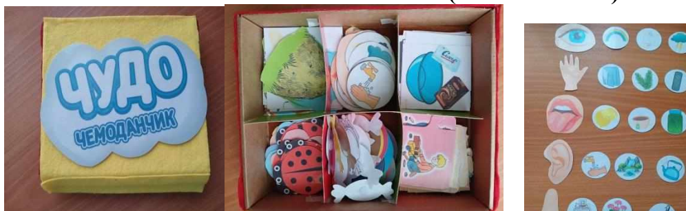
Фото пособия (не более 3 шт).